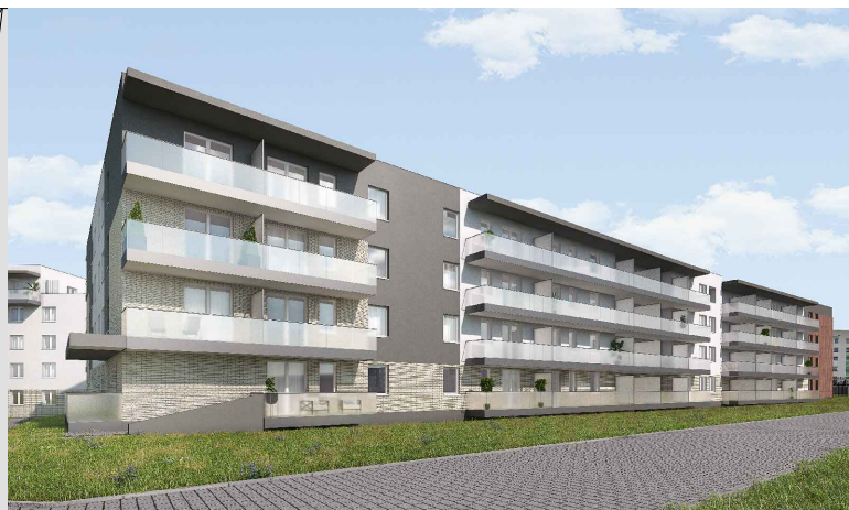
ul. kpt. Kazimierza Kamińskiego