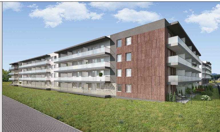
ul. kpt. Kazimierza Kamińskiego